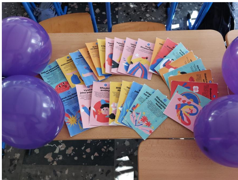
Metodické karty Ú(klid) v hlavě

Dalším krokem k posílení bezpečného a podporujícího prostředí bylo zapojení školy do 2. ročníku celostátní akce Týden pro wellbeing ve škole, který probíhal ve dnech 4. – 11. února. Studenti všech ročníků měli možnost diskutovat o tom, co wellbeing znamená, jak jej sami vnímají a jak se promítá do prostředí školy. Součástí programu byly celý týden také praktické aktivity zaměřené na podporu duševní pohody, například techniky zvládání stresu prostřednictvím metodických karet Ú(klid) v hlavě.