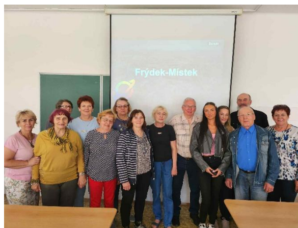
Průvodcování Frýdkem a program ve škole