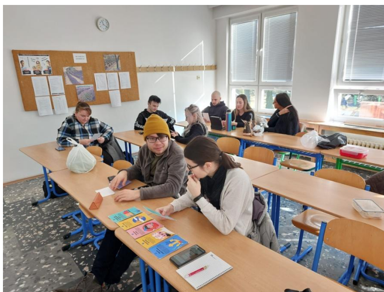
Studenti se seznamují s technikami pro zvládání stresu

V rámci minimálního preventivního programu spolupracuje školní poradkyně s učiteli, zejména s vedoucím učitelem ročníku a vedoucí studijního oddělení.