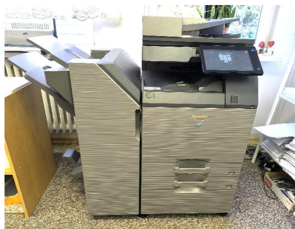
SHARP BP-60C31- knihovna