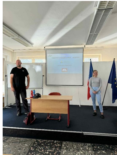
Nabídka spolupráce s resortem Bílá