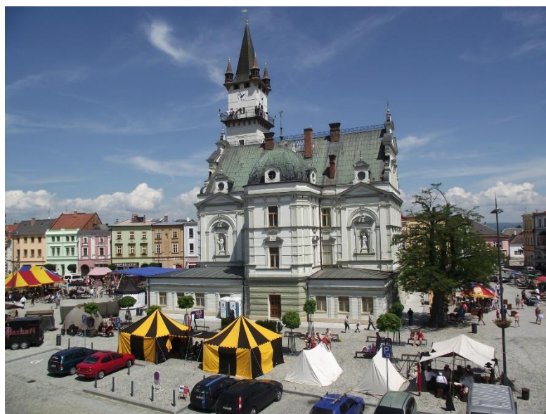
Zájezd Za krásami Uničova

Projekt Seniorská akademie, který je finančně podporován statutárním městem Frýdek-Místek, byl zahájen v září 2015, v tomto školním roce pokračoval již desátým rokem. V září 2025 se v 5 skupinách se vyučovaly předměty Zeměpis cestovního ruchu – Evropa, Osobní finance a Historie Moravy a Slezska V – Historie beskydské turistiky. Celkem studovalo 144 studentů – seniorů v 5 studijních skupinách. Výuku zpestřil zájezd Za krásami Mikulova a dobrého vína.