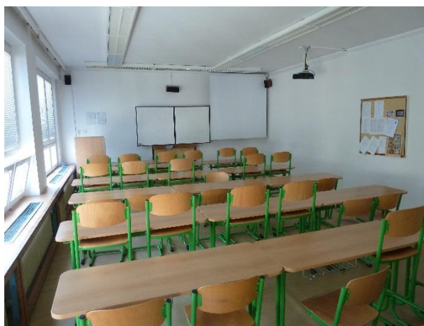
Učebna II 35