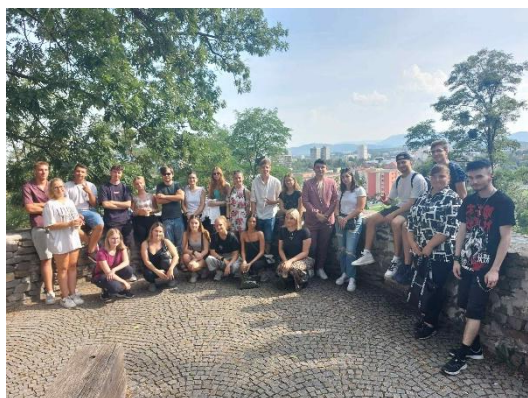
Procházka po Frýdku-Místku

Po zábavné části následovala prohlídka školy a také města Frýdku-Místku. Starší studenti předali novým spolužákům informace, které jim pomohou lépe se zorientovat a rychleji si zvyknout v novém prostředí.