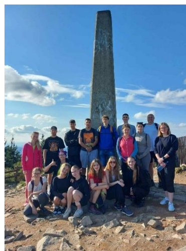
Na vrcholu Lysé hory

K odpočinku a neformálnímu setkávání sloužilo zázemí resortu s bowlingem a bazénem. Součástí soustředění byly také seznamovací hry, při nichž měli studenti možnost dozvědět se zajímavé informace o svých spolužácích.