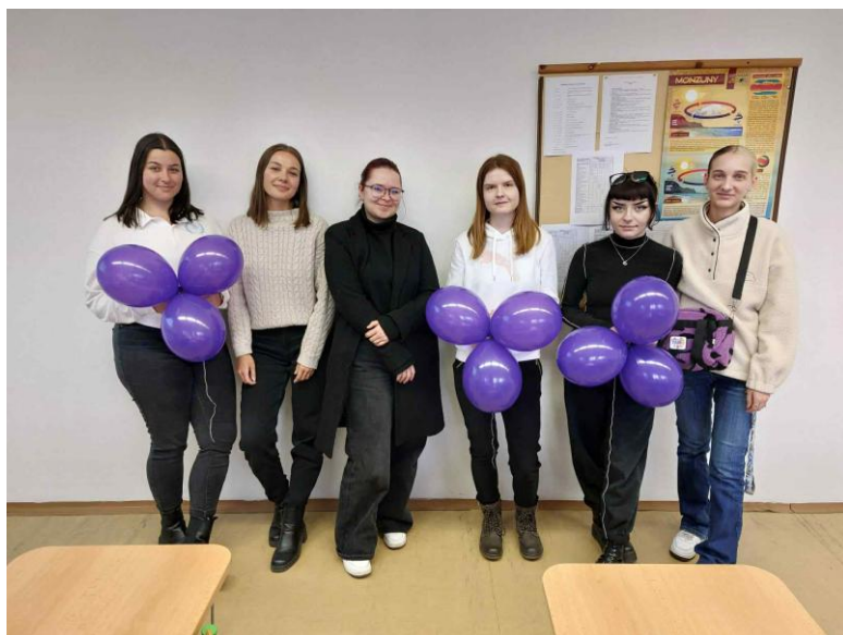
Týden pro wellbeing ve škole