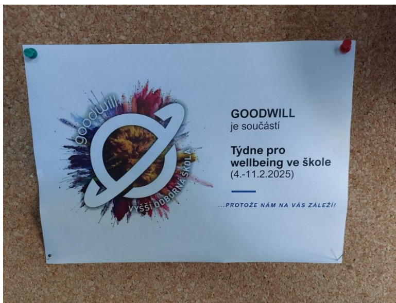
Týden pro wellbeing ve škole

v rámci naší školy. Studenti si vyzkoušeli i několik konkrétních aktivit pro lepší wellbeing, např. jak lépe zvládat stres pomocí metodických karet Ú(klid) v hlavě.