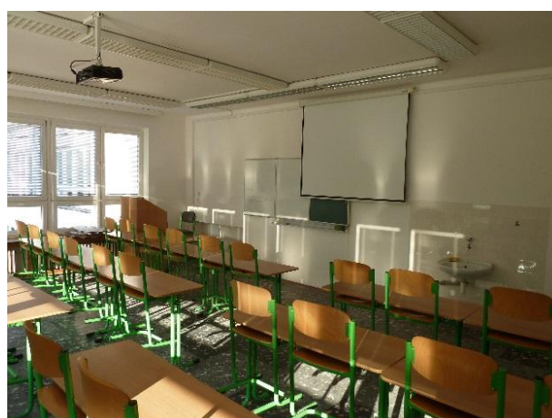
Učebna II 39