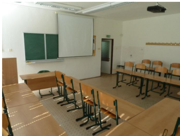
Učebna I 3