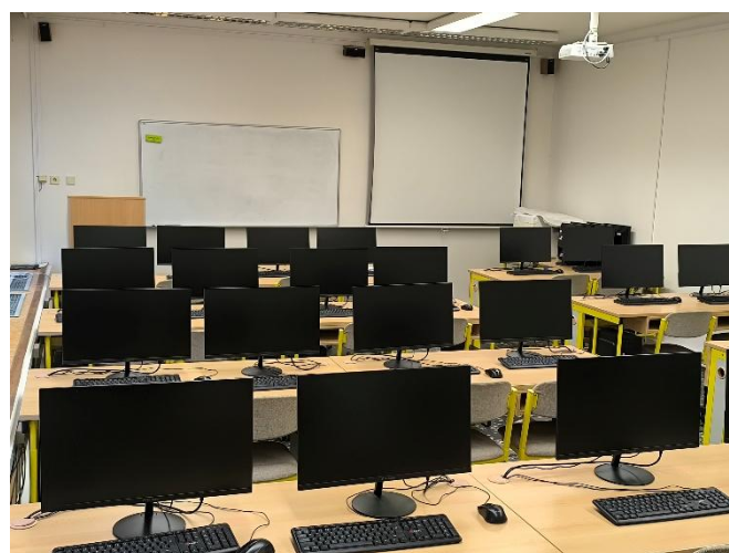
Učebna II 41 – učebna VT

PC s prezentačním pultem 26 PC, PC stoly se židlemi dataprojektor promítací plátno ozvučení