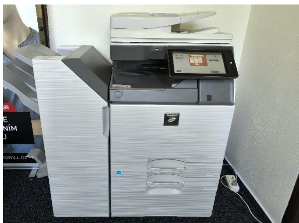
SHARP MX 3060v – účtárna