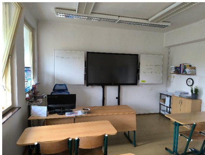
Učebna II 40 – jazyková učebna

PC dataprojektor ozvučení interaktivní tabule, bílá tabule