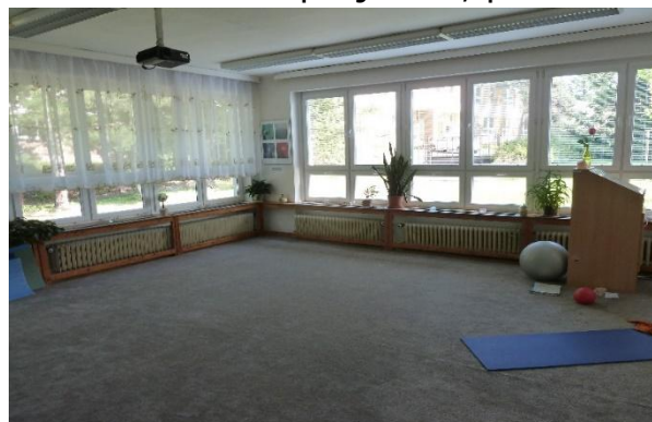
Učebna I 2

PC s prezentačním pultem dataprojektor, promítací plátno, ozvučení