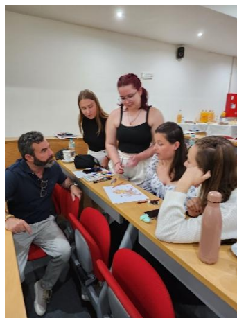
Studentský tým SEEN na mezinárodních setkáních

Od 1. 2. 2023 je škola zapojena v rámci výzvy Šablony pro SŠ a VOŠ III do projektu Zkvalitnění výuky prostřednictvím vzdělávání pedagogů III, registrační číslo CZ.02.02.XX/00/22_003/0003441. Realizace projektu trvá do 31. 1. 2026.