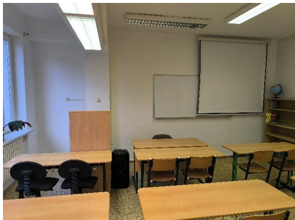
Učebna I 1

PC s prezentačním pultem dataprojektor promítací plátno ozvučení