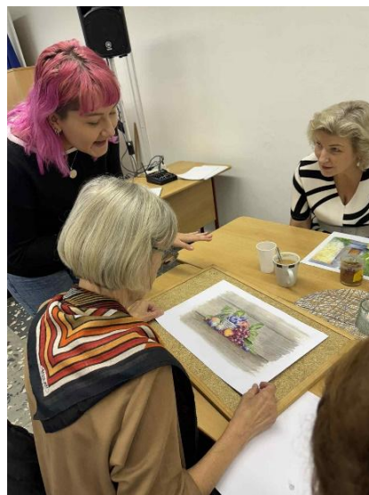
Spolupráce se Seniorskou akademií

Zástupci školy se pravidelně účastní výstav a veletrhů vzdělávání i odborných seminářů týkajících se podnikání v oblasti cestovního ruchu i zahraničního obchodu. V listopadu jsme se opět účastnili veletrhu vzdělávání Gaudeamus v Brně.