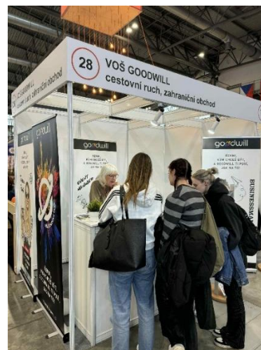
Stánek na veletrhu Gaudeamus

Zástupci školy se pravidelně účastní výstav a veletrhů vzdělávání i odborných seminářů týkajících se podnikání v oblasti cestovního ruchu i zahraničního obchodu. V listopadu jsme se opět účastnili veletrhu vzdělávání Gaudeamus v Brně.