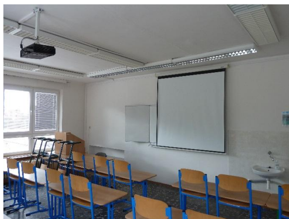
Učebna II 31