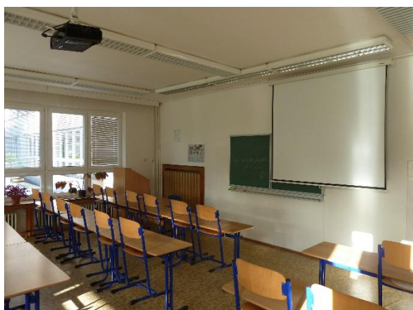
Učebna I 13