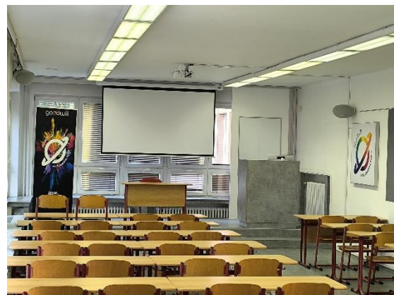
Učebna I 19 – Přednáškový sál